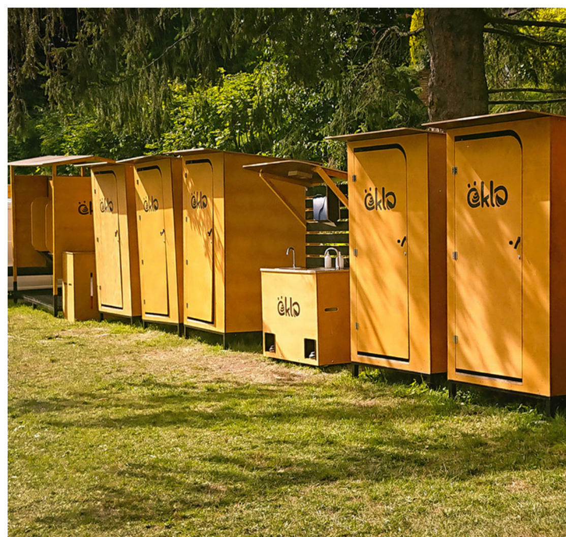
Komposttoiletten von Öklo @Öklo.at

Jede Toilettenspülung verbraucht zudem 3-5 Liter Trinkwasser und befördert dieses wertvolle, saubere Wasser direkt in die Kanalisation. Als Schwarzwasser endet dies dann im Klärwerk. Dass das auch anders geht, ganz ohne Wasserverbrauch zeigen Trenntoiletten. Firmen wie Öklo , Goldeimer , Ökoloc und Finizio , bieten solche Trenn- oder auch Kompostklos für Festivals oder daheim an. Bekannt sind diese Trenn- oder Komposttoiletten vielen auch schon vom Campingurlaub oder Tinyhouse. Flüssigkeiten werden dort ganz einfach durch Schwerkraft und ein Gitter von Feststoffen getrennt. Sägespäne verhindern Geruchsbildung, und Wasser wird gespart.