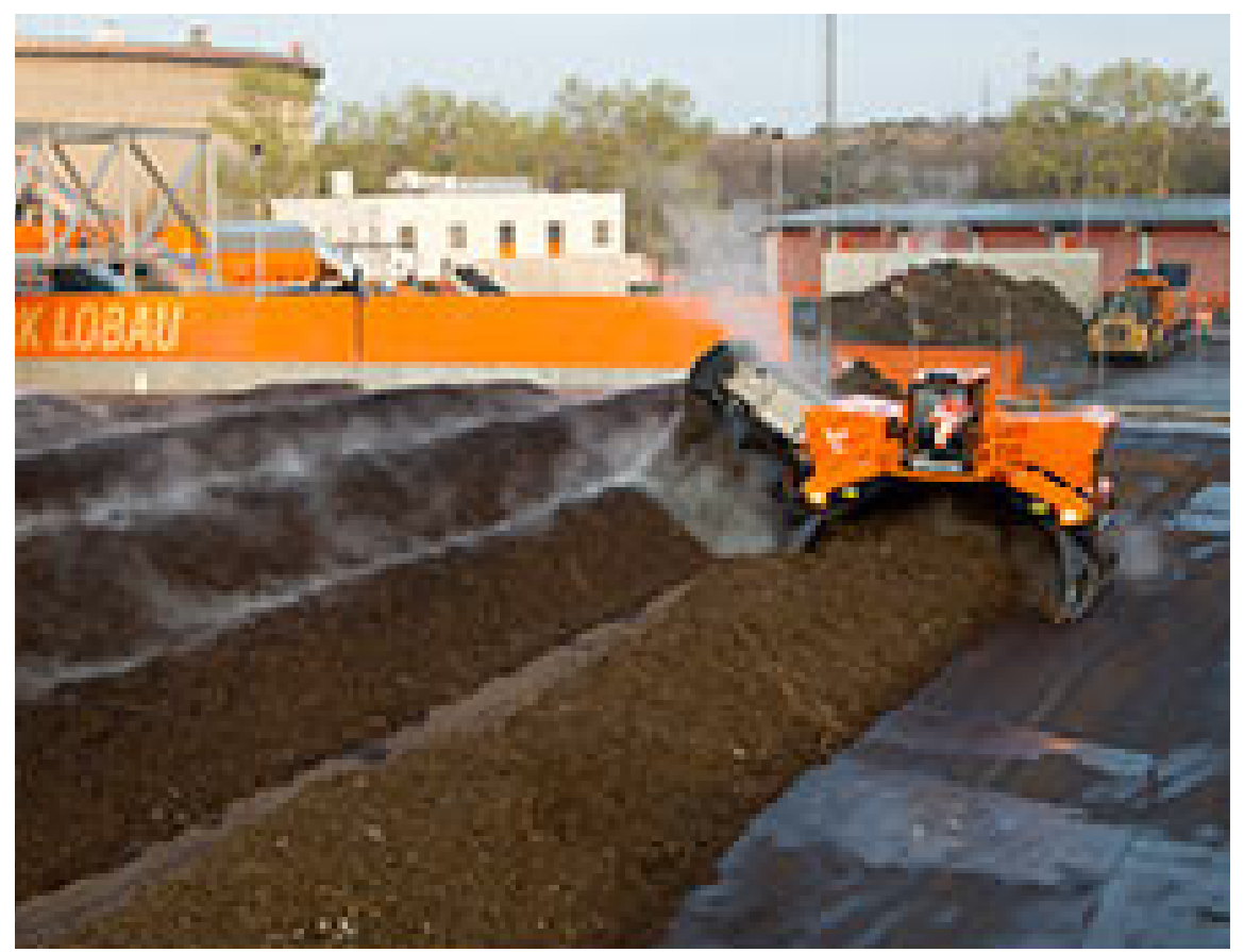
Kompostumsetzung im Kompostwerk Loabu

Aus der Ökologie sind Phosphor-, Stickstoff- und Kohlenstoffkreisläufe bekannt. Jedoch werden nicht nur in der Natur große Mengen an Nährstoffen umgewandelt und bewegt. Der Mensch befördert viele Nährstoffe vom Land in die Städte. Wenn diese auf Deponien enden und ungenutzt bleiben, oder als Treibhausgase in die Atmosphäre entweichen, geht nicht nur ihr potenzieller Nutzen verloren, sondern sie richten unter Umständen sogar Schaden an. Für die Nahrungsmittelsicherheit ist es wichtig, dass Nährstoffe dem Land nicht nur entzogen, sondern auch zurückgeführt werden.