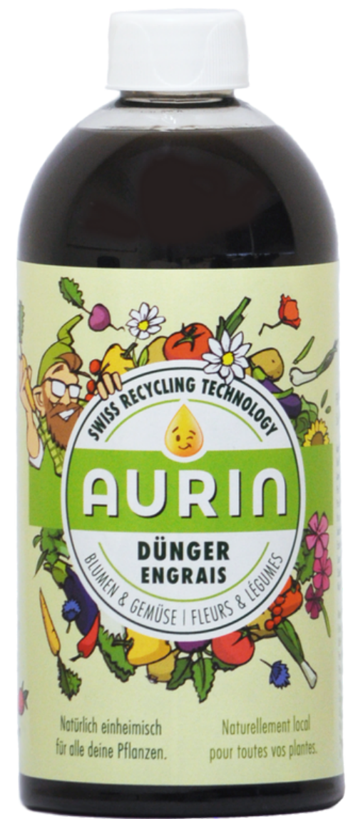
Urindünger Aurin @vuna.ch

Während Klärschlamm jedoch auf Böden ausgebracht werden darf, ist dies für menschliche Exkremente, auch nach Kompostierung, derweil noch nicht erlaubt. Es könnte aber sein, dass auch menschliche Fäkalien bald als Dünger zugelassen werden. Für eine Legalisierung von Humusdünger aus Inhalten von Trockentoiletten engagiert sich zum Beispiel das Netzwerk für nachhaltige Sanitärsysteme e. V. ( NetSan ) und in Deutschland gibt es seit 2020 auch eine DIN-Richtlinie die Qualitätsstandards für menschliche Exkremente für die landwirtschaftliche Nutzung festlegt. In der Schweiz gibt es seit 2018 den ersten Urindünger auf dem Markt, Aurin. Dieser wird von der Vuna GmbH vermarktet, die auch die Urin-Recycling-Technologie selber verkauft. Vieles geschieht also in Richtung Nährstoffwiederverwertung im Sanitärbereich.