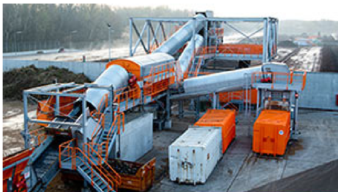
Im Kompostwerk Loabu werden jährlich 100.000 Tonnen Kompostrohmaterial aufbereitet @MA48 wien.gv.at