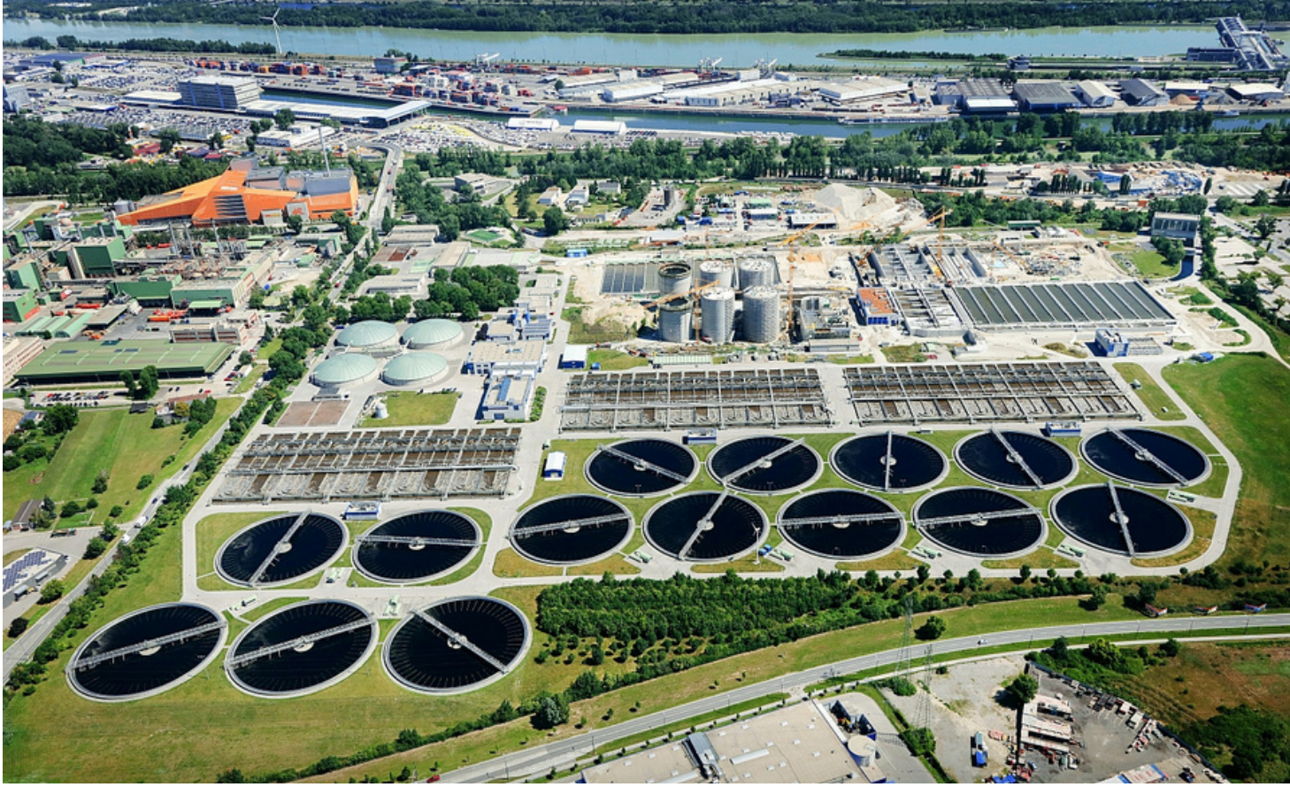
500 Mio. Liter Abwasser fallen täglich in Wien an, diese landen in der ebsWien Kläranlage, im Idealfall werden diese binnen 20 Stunden gereinigt und in die Donau eingeleitet @ebswien

Österreichs öffentliche Abwasserentsorgung ist im Bereich der konventionellen Abwasserbehandlung mit einem Anschlussgrad an die Kanalisation von 95% europaweit führend. Dabei behandeln österreichweit über 1800 Kläranlagen den Großteil des gesammelten Abwassers und daneben gibt es ca. 27.500 Kleinkläranlagen (KKA) verschiedenster Bauarten für weniger als 50 EW, wobei es für KKA in Extremlagen (3. AEVKA) wie Filtersacksystemen, oder Komposttoiletten zusätzliche Regelungen gibt.