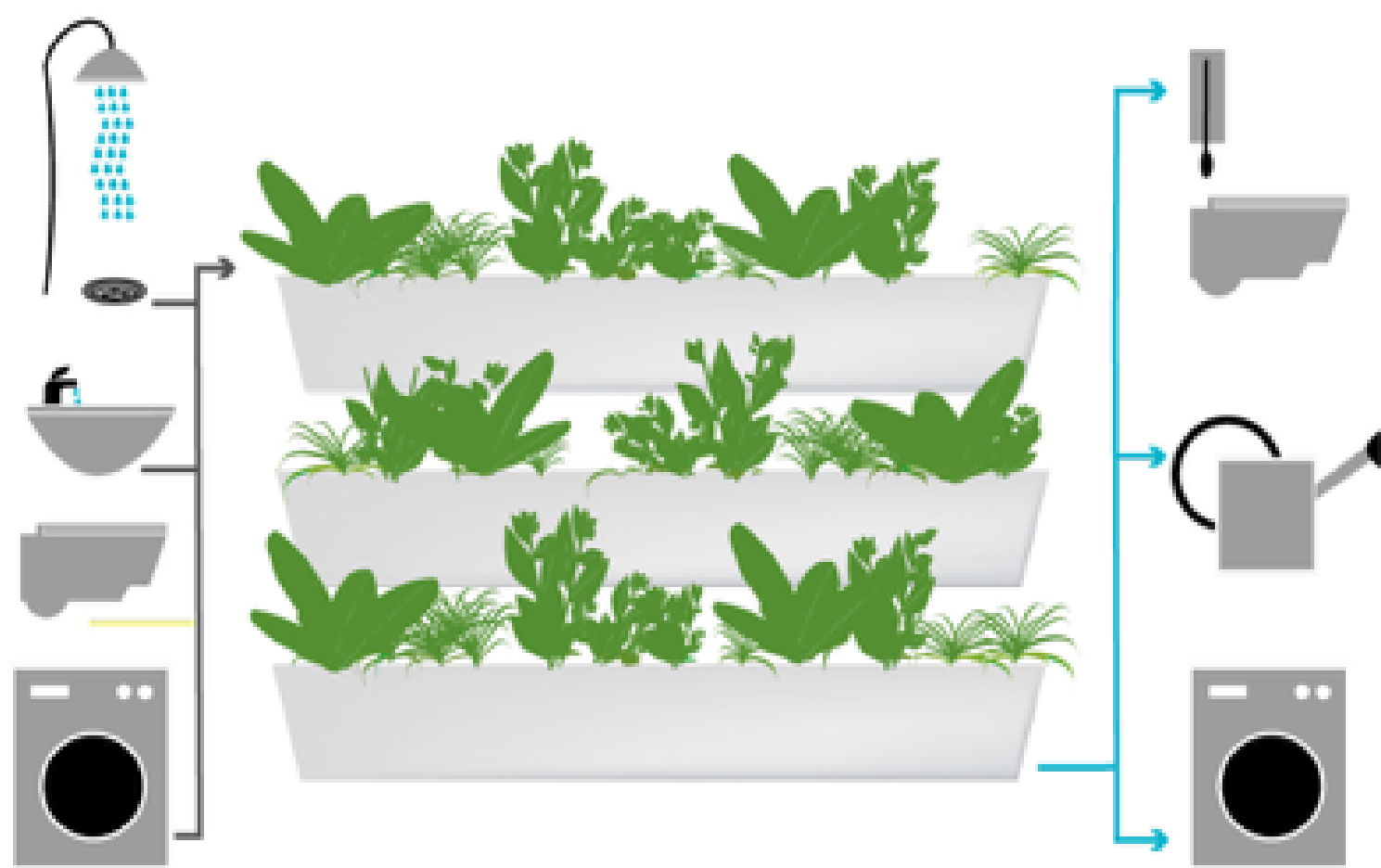
schematische Darstellung der Wasserwiederverwendung durch Pflanzenkläranlagen @alchemia-nova

Unzureichendes Wassermanagement führt zu einer Verschlechterung der Ökosysteme und zusammen mit mangelnder Hygiene direkt und indirekt zu zahlreichen Krankheiten und mehreren Millionen Toten im Jahr weltweit. Auf der anderen Seite ist Abwasser aber auch eine potentielle Ressource, die nach angemessener Behandlung zur Linderung der Wasserknappheit durch Wasserwiederverwendung vor Ort beitragen kann und gleichzeitig auch Nährstoffe liefern kann, die teure und zumeist mineralische Dünger ersetzen.