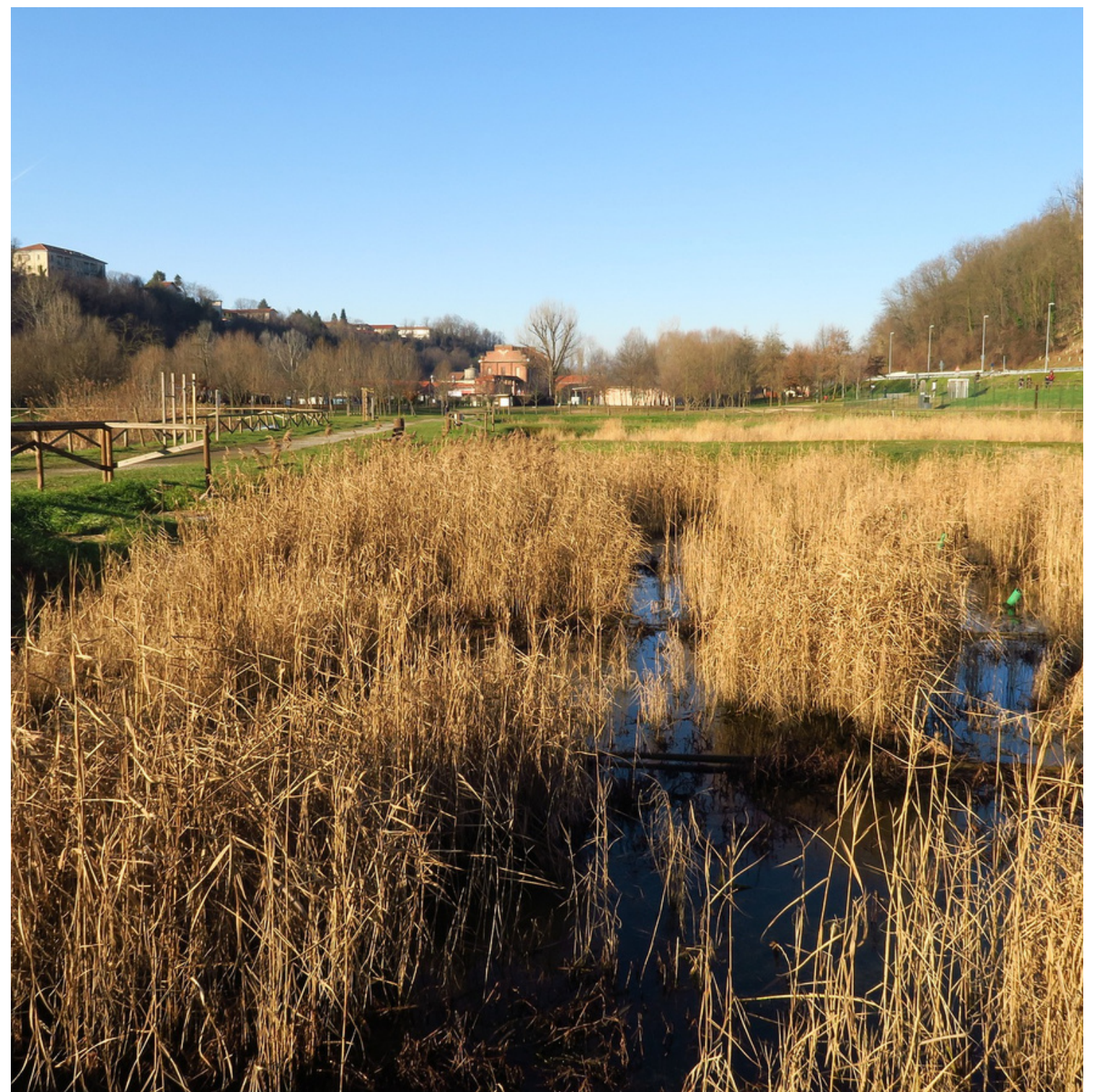
bepflanzte Sickergrube zur Reinigung von Abwasser

Österreich hat strenge Abwasserstandards für die Entfernung organischer Stoffe und zusätzlich für die Nitrifikation. Für die Abwasser-Wiederverwendung gibt es seit 2021 eine EU-Verordnung zur Wiederverwendung von Wasser. Laut dieser Verordnung gibt es vier verschiedene Mindestgüteklassen (A, B, C und D) von aufbereitetem Wasser, die bestimmen welche Bewässerungsmethoden erlaubt sind und welche Kategorien an Kulturpflanzen damit bewässert werden dürfen. Auf dieser Basis gibt es in Österreich seit kurzem die zugehörige ÖNORM B 2500, die auf nationaler Ebene gültig ist.